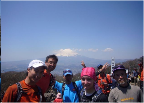
絶景かな、絶景かな！