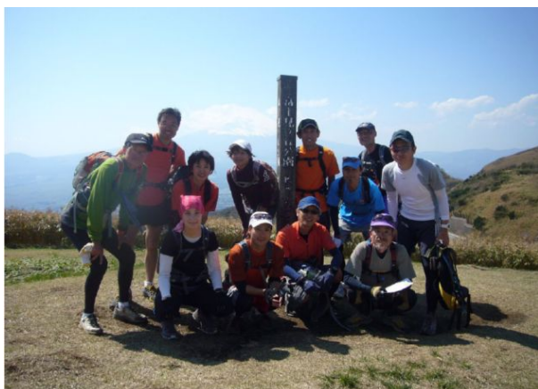
富士見が丘公園（中級コース）