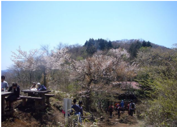
豆桜が咲いてました

乙女峠も富士山を望むビューポイント。ここには休憩できるお茶屋さんもあります。「乙女峠」という名前も良いですね、特に女性陣には。男性陣も負けずに(?)ここで集合写真を撮りました。