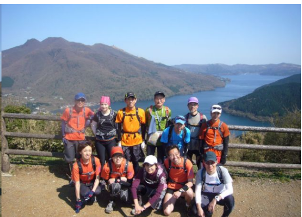
湖尻展望台（中級コース）