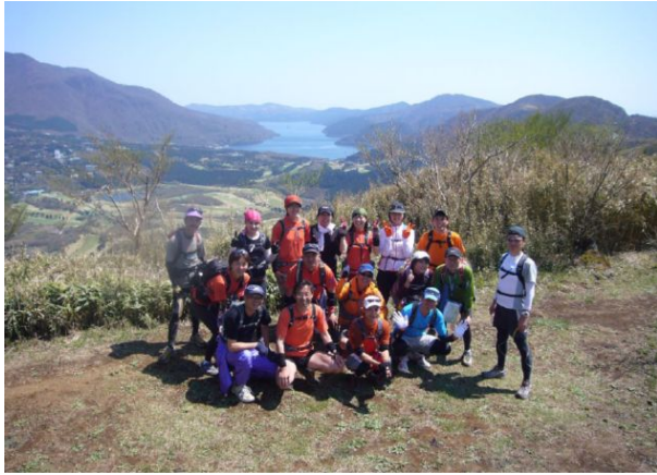
丸岳から長尾峠に至る間のビュー・ポイント