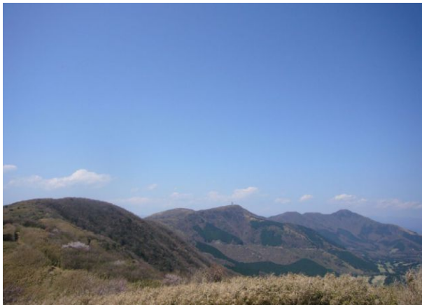
金時山（右端）、丸岳（中央）を望む

並行して走る箱根スカイライン方向には、またまた富士の絶景！ 湖尻の展望台まで、景色を堪能しつつ走ったのでした。